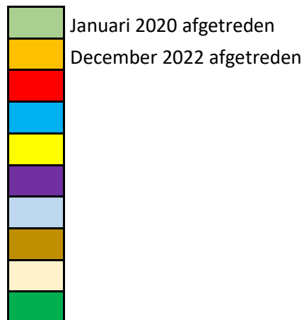
Bijlage: rooster van aftreden.